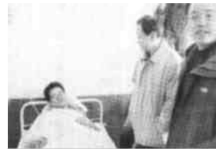
山东省及辽宁省大连市的有关官员在砬矶岛医院看望受伤的大连船员。

船在不断倾斜，救助船舶仍未到达现场。张春贤心情沉重，对搜救中心所有人员说道：“时间就是生命，多争取一分钟时间，就是一条生命。催促救助船舶要快点再快点。”16时30分，渔船“鲁长渔3045”号出现在遇险人员的视线内，赶到现场。此时，遇险船已经倾斜40多度。遇险船上开始放下救生圈。17时零5分，交通部海事局常务副局长刘功臣与“艾丁湖”轮船长通话：“到达现场后，请担任现场指挥协调，向遇险船舶喊话，让旅客有组织地接受救助，不要乱。”