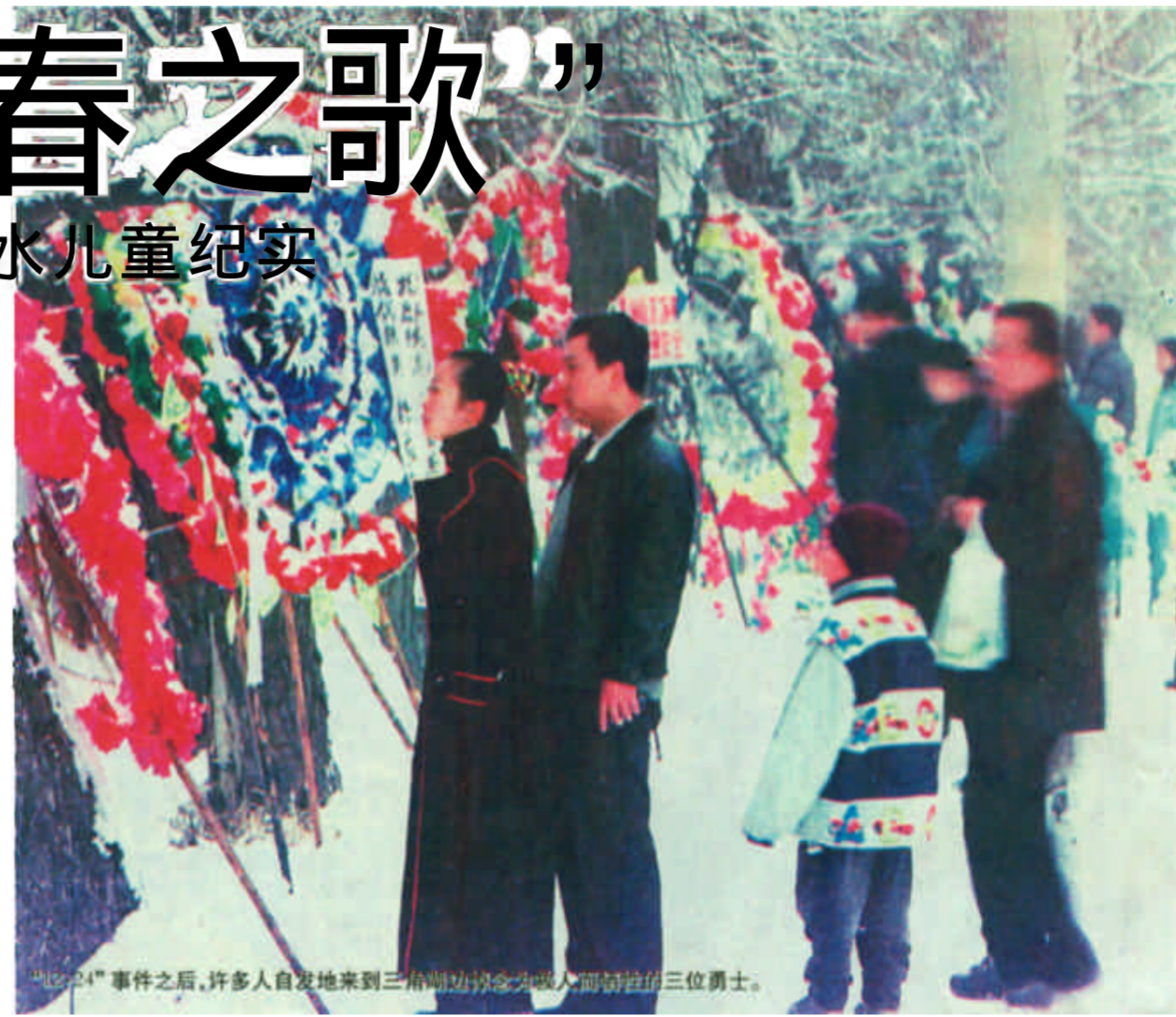
“12·14”事件之后，许多人自发地来到三角湖边悼念为救人而牺牲的三位勇士。

这是一种正义的力量，是一种伟大的英雄气概。英雄已去，高山仰止。他们用美丽的青春唱响了一曲荡气回肠的正气歌，他们的青春热血和年轻生命传承着中华民族伟大的传统精神：珍爱自己更关心别人，爱洒人间，温暖社会。