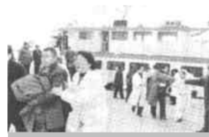
山东省烟台市专派的“海神9”号客船抵达蓬莱港，医护人员搀扶着几名受伤的遇险者下船。

17时16分，中国海上搜救中心和遇险船舶的电话终于打通了，张春贤叮嘱船长：“请船长现场发挥自己的经验，组织旅客，沟通救助船，要喊话告诉旅客逃生方法。”17时19分，先后有17名旅客，乘坐救生筏，被“鲁长渔3045”号救上甲板。一条渔船和一艘军舰赶到现场，其他人获救的希望，在搜救中心人员的心中升起。17