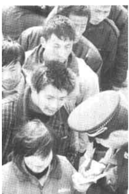
渤海沉船事故中被救起的77名沉船遇险者，除两名砬矶岛人留在岛上外，其余75人全部乘坐“海神9”号客船安全返回蓬莱市。

中国海上搜救中心马上把险情报告国务院值班室，国务院领导立即指示，要求奋力抢救，及时请有关方面协助搜救，并请海军支援，尽一切力量避免人员伤亡。交通运输部张春贤、交通部海事局常务副局长刘功臣、交通部救捞局党委书记周世旺等立即赶到中国海上搜救中心值班室。张春贤要求参加救助的有关单位和船舶，坚决贯彻国务院领导指示，要本着对所有旅客和船员以及全社会高度负责的精神，全力组织搜救，尽一切力量避免人员伤亡。14时50分，正在烟台锚地值班